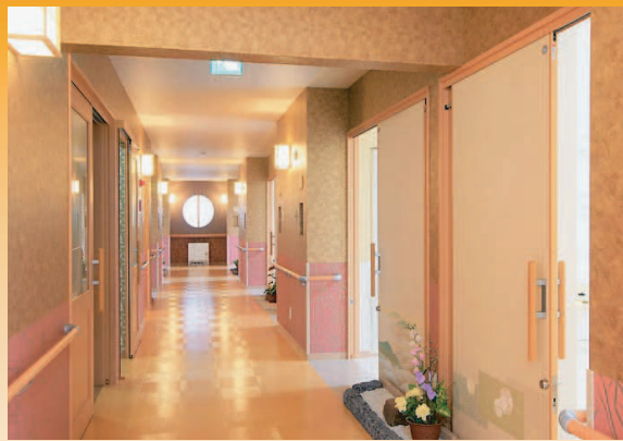
落ち着く和風の廊下