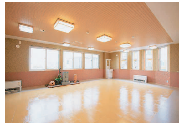
普段は食堂として使用し、落ち着いた雰囲気です。