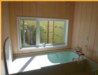
中庭を見渡せる浴室