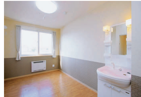
居室にトイレと洗面台を設置しております。