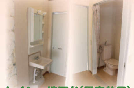
トイレ・洗面台(居室共同)