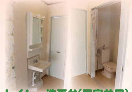
トイレ・洗面台(居室共同)