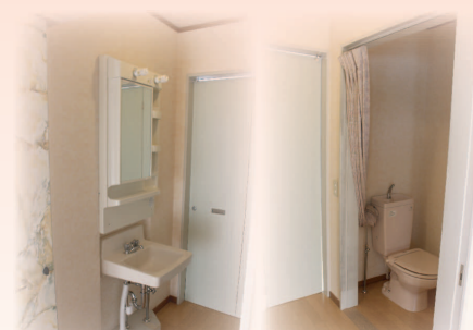
トイレ・洗面台(居室共同)