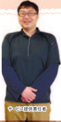
サービス提供責任者

プライバシーが守られ、 家族的な雰囲気を大切に しています。 広く明るいフロアは入居者の くつろぎの場となっています。 職員一同、心からご入居を お待ちしております。