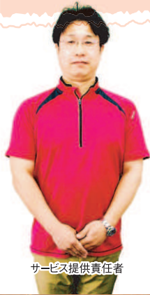
サービス提供責任者

プライバシーが守られ、 家族的な雰囲気を大切に しています。 広く明るいフロアーは入居者様の くつろぎの場となっています。 職員一同、心からご入居を お待ちしております。