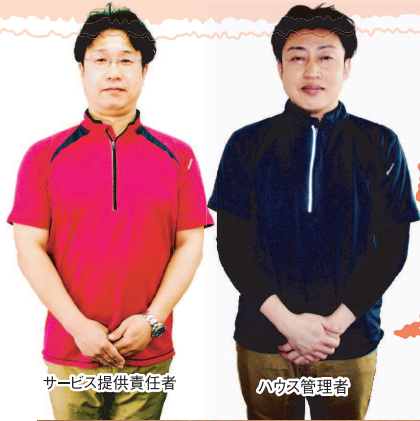
サービス提供責任者