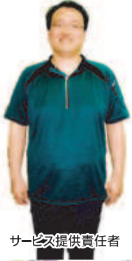
サービス提供責任者

プライバシーが守られ、 家族的な雰囲気を大切に しています。 広く明るいフロアーは入居者の くつろぎの場となっています。 職員一同、心からご入居を お待ちしております。