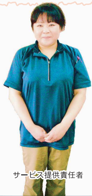
サービス提供責任者

プライバシーが守られ、 家族的な雰囲気を大切に しています。 広く明るいフロアは入居者様の くつろぎの場となっています。 職員一同、心からご入居を お待ちしております。