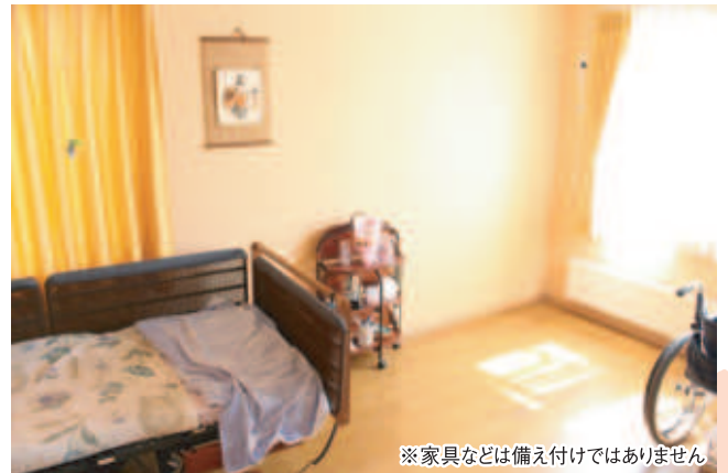
※家具などは備え付けではありません