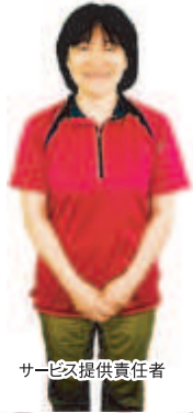
サービス提供責任者

プライバシーが守られ、 家族的な雰囲気を大切に しています。 広く明るいフロアーは入居者様の くつろぎの場となっています。 職員一同、心からご入居を お待ちしております。